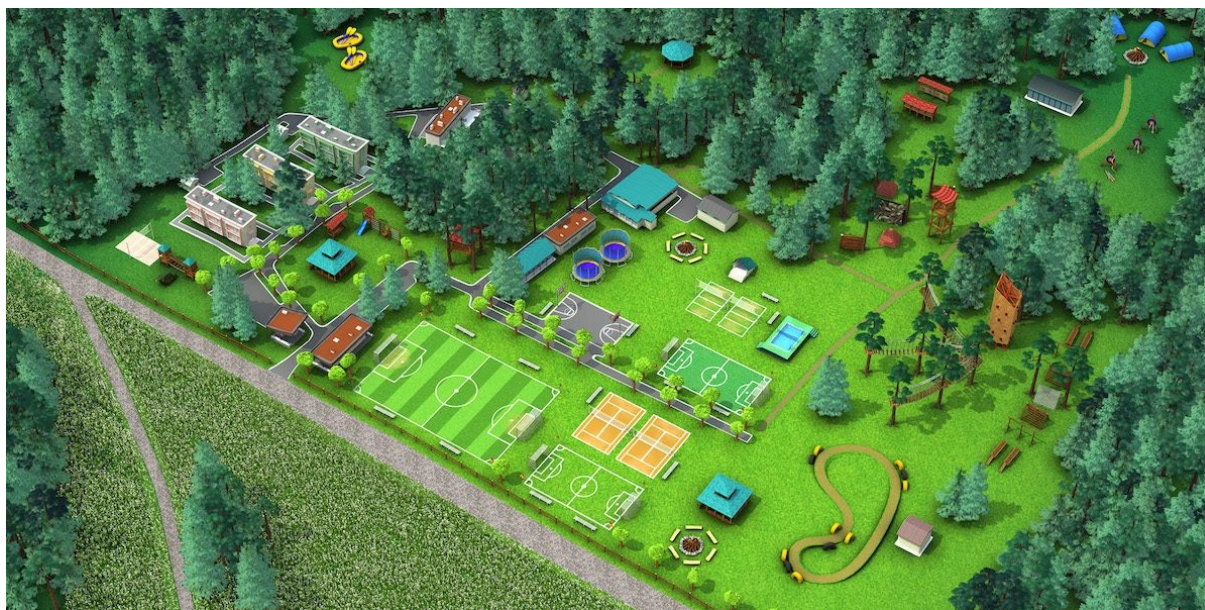
O.W. SPORTOWA OSADA